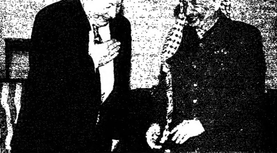
رئيس الوزراء التركي يحيي الرئيس عرفات لدى لقائهما امس في انقرة